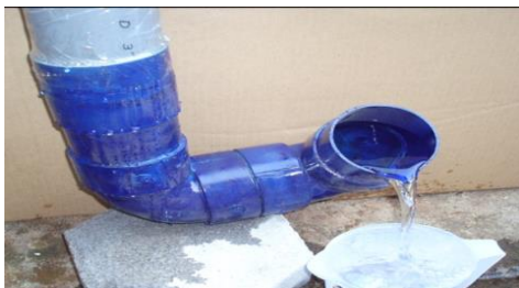
Gambar 3. Uji Permeabilitas