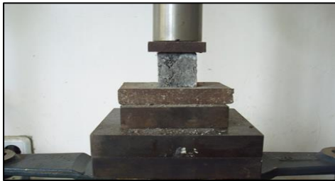
Gambar 2. Uji Kuat Tekan Kubus