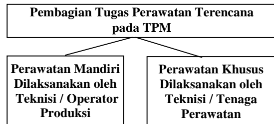
Gambar 1. Pembagian Tugas Perawatan Terencana pada TPM

pembagian tugas secara proporsional dan terpadu. Penerapan perawatan fasilitas berbasis Total Productive Maintenance adalah perawatan terencana yang dapat dibedakan berdasarkan jenis pekerjaan yang dilakukan. Untuk pekerjaan perawatan mandiri dilaksanakan oleh operator bagian produksi dan pekerjaan perawatan khusus dilaksanakan oleh bagian perawatan.