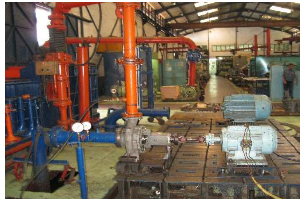
Gambar 2. Pengujian pompa

Pada saat performan test, putaran motor yang menggerakkan pompa divariasikan dan debit yang dihasilkan dibuat konstan yaitu sebesar 74,3 m 3 /h. Sesuai aturan JIS, penentuan performance pompa harus mengikuti kaidah berikut :