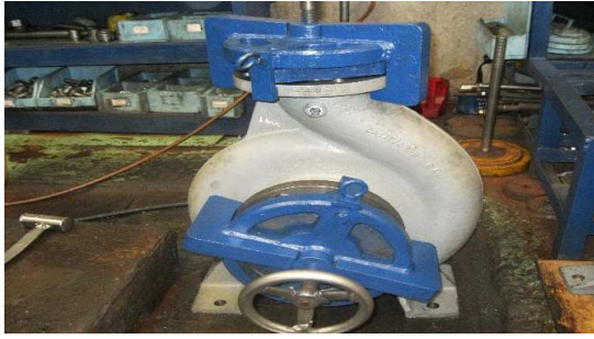
Gambar 1. Proses Water Pressure Test

Proses produksi pompa telah banyak menarik keingintahuan peneliti salah satunya Galih (2010) yang tertarik menganalisis kegagalan shaft stainless steel 17-4 PH pada pompa sentrifugal. Dari penelitian yang telah dilakukannya didapatkan kesimpulan adanya awal retakan ( crack initiation ) terjadi karena adanya konsentrasi tegangan pada daerah rumah pasak yang memiliki sudut yang tajam. Sehingga Galih (2010) menyarankan penggunaan NDT ultrasonic testing dan liquid penetrant test untuk mengantisipasi adanya indikasi kegagalan komponen poros pompa terutama pada bagian yang berhubungan dengan impeller.