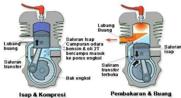
Gambar 1. Roda Gigi

Penampilan gambar tidak ada aturan baku namun intinya harus jelas dan terbaca, tidak terlalu besar dan tidak terlalu kecil. Setiap menampilkan gambar harus ada rujukan di bagian narasi misal "...lebih jelas dapat dilihat pada Gambar 1". Judul Gambar diletakkan di tengah bawah gambar.