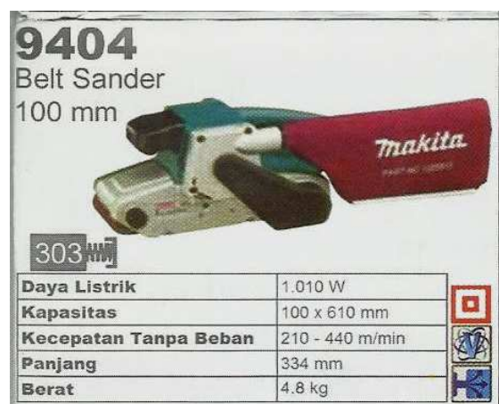
Gambar 2. Mesin Makita Belt sander 9404