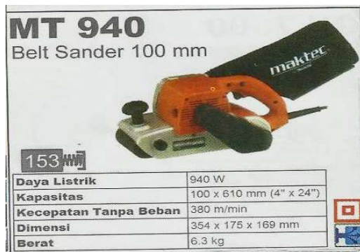
Gambar 3. Mesin Maktec Belt Sander MT 940