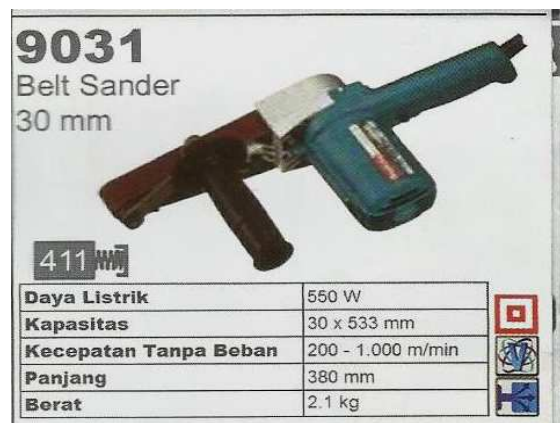
Gambar 1. Mesin Makita Belt Sander 9031

Mesin amplas pada dasarnya untuk membuat permukaan benda menjadi lebih halus dengan cara pengikisan permukaan. Mesin amplas sistem sabuk penggerak motor listrik hasil rancang bangun ini akan digunakan untuk membantu proses pengamplasan benda kerja pada praktikum uji kekerasan bahan dan metalografi. Kertas amplas yang digunakan berstruktur kasar dan berbentuk sabuk. Cara kerjanya sabuk dihubungkan pada poros yang digerakan oleh motor listrik 0,5 HP, putaran 1400 rpm dengan transmisi sabuk puli dan reducer 1 : 4. Benda kerja didekatkan pada amplas seperti pada mesin meggerinda, Macam-macam mesin amplas yang ada dipasaran diantaranya adalah mesin amplas Makita Belt Sander 9031 berdimensi 30 x 533 (mm) dengan putaran 200 - 1000 m/menit (Anonim, 2013) Gambar 1, mesin amplas Belt Sander Makita 9404 dimensi 100 x 610 (mm), putaran 210 - 440 m/menit (Anonim, 2013) Gambar 2. Gambar 3 adalah Mesin amplas Maktec MT 940 dimensi 100 x 610 (mm), putaran 380 m/menit (Anonim, 2013). Mesin amplas system sabuk yang dihasilkan berkapasitas 0,271 \text{ (mm}^3/\text{s)} pada putaran 46,7 (rpm), kekasaran permukaan N8.