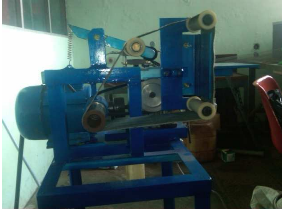
Gambar 6. Mesin Amplas Sistem Sabuk