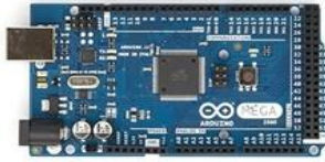
Gambar 4 : Papan Arduino Mega 2560 R3

menggunakan kabel USB atau dengan adaptor AC-DC atau baterai untuk memulai pemrogramannya. Bentuk fisik dari papan Arduino Mega 2560 R3 ditunjukkan seperti pada Gambar 4.