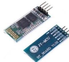
Gambar 3: Bluetooth HC-05

HC-05 memiliki 2 mode konfigurasi, yaitu AT mode dan Communication mode . AT mode berfungsi untuk melakukan pengaturan konfigurasi dari HC-05. Sedangkan Communication mode berfungsi untuk melakukan komunikasi bluetooth dengan piranti lain. Bentuk fisik dari bluetooth HC-05 ditunjukkan pada Gambar 3.