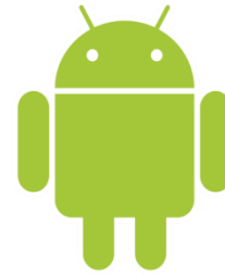
Gambar 3: Lambang Android

Android adalah sebuah sistem operasi untuk perangkat mobile berbasis linux yang mencakup sistem operasi, middleware , dan aplikasi. Android menyediakan platform yang terbuka bagi para pengembang untuk menciptakan aplikasi. Android awalnya dikembangkan pada tahun 2003 di Palo Alto, California, AS oleh Andi Rubin, Rich Miner, Nick Sears, dan Chris White untuk mengembangkan perangkat seluler pintar yang lebih sadar akan lokasi dan preferensi penggunaannya. Pada awal perkembangannya, mereka ( Android Inc. ) mendapat dukungan finansial dari Google yang kemudian membelinya pada tahun 2005. Sistem operasi ini dirilis secara resmi pada tahun 2007. Semenjak awal peluncurannya, Android dilambungkan dengan bentuk menyerupai robot berwarna hijau seperti terlihat pada Gambar 3.