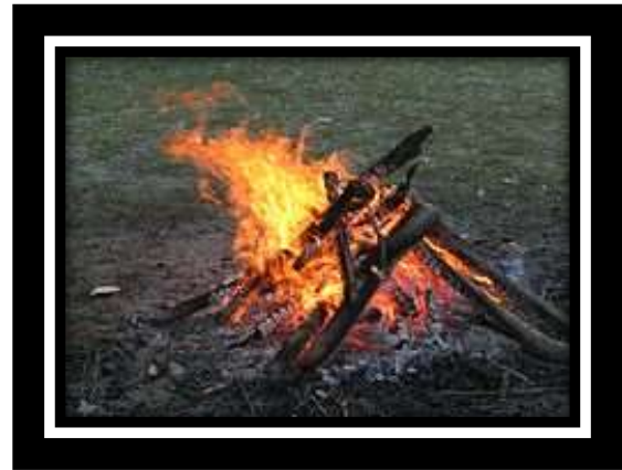
Gambar 2. Api.

Saya setiap habis shubuh selalu terapi dengan cara api unggun istilah jawa adalah gegenen badan atau menghangatkan raga, dengan menlunturkan kolestor jahat yang ada dibadan kurang lebih selama tiga bulan.