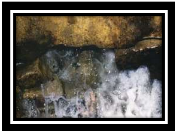
Gambar 3. Sumber Air Zam-Zam

yang saat ini sudah kering. Atau dapat pula merupakan dataran rendah hasil runtuhnya atau penumpukan hasil.