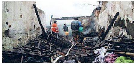
Gambar 1. Kebakaran akibat bunga api listrik

Konsep tersebut menggambarkan kondisi pada lingkungan sekitar yang mempengaruhi, merubah, dan menentukan perilaku api yang terjadi. Perilaku api didefinisikan oleh De Bano (1998) sebagai suatu respon atau kebiasaan api yang terbentuk sebagai hasil interaksi api dengan lingkungannya.