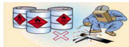
Gambar 6. Kategori ruang yang mudah meledak

Kebakaran listrik juga dapat timbul karena arus bocor disebabkan kegagalan isolasi, sehingga media yang dilalui arus menjadi panas, dan mengakibatkan kebakaran. Hal yang mungkin sering terjadi juga dapat disebabkan beban yang berlebihan pada alat listrik yang menyebabkan panas pada alat tersebut sehingga menyebabkan kebakaran.