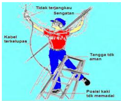
Gambar 7. Faktor kesalahan manusia

Lingkungan dimana instalasi , beban dan peralatan yang aan dipasang harus disesuaikan dengan lingkungan yang ada, apakah sudah sesuai atau belum.