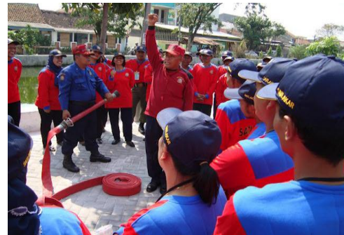
Gambar 8. Kecepatan dan tanggapan kebakaran

Penanggulangan kebakaran bagaimanapun juga menjadi kewajiban semua pihak baik masyarakat maupun pemerintah. Sesuai dengan keputusan menteri pekerjaan umum nomor : 11/KPTS/2000 , pada bagian 6 tentang peran serta satuan relawan kebakaran ( satlakar ) masyarakat, bahwa satlakar merupakan wadah partisipasi rasa tanggung jawab masyarakat dalam rangka mengatasi ancaman bahaya kebakaran. Pembentukan organisasi Satlakar sepenuhnya atas inisiatif masyarakat.