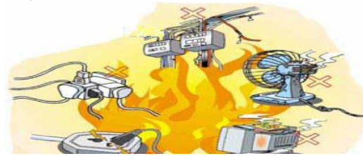
Gambar 5 . Beban berlebihan terjadi kebakaran

terbakar yang tidak tergolong dalam konstruksi biasa (tipe III) ditentukan mempunyai angka klasifikasi konstruksi 1,0.