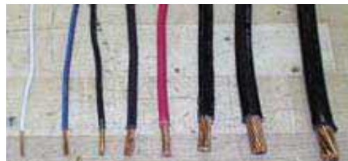
Gambar 2. Pemilihan kabel tepat ukuran