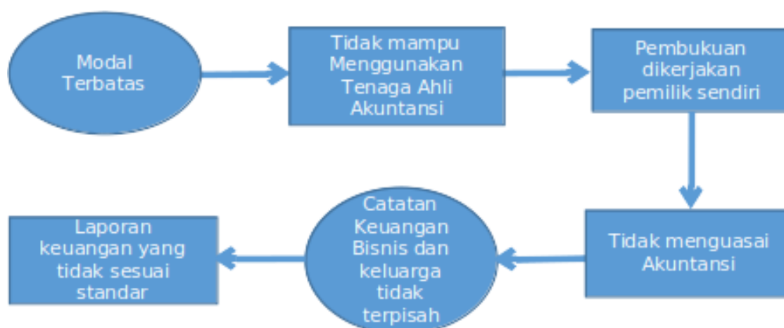
Gambar 1. Permasalahan SIA di UMKM

Selain karena pembukuan yang mayoritas masih dilakukan oleh pemilik, Hasil survey juga menemukan bahwa hambatan UMKM dalam melakukan pembukuan adalah kurangnya pemahaman pemilik atau anggota atau staf UMKM mengenai pembukuan keuangan, karena pembukuan keuangan yang sesuai diminta oleh perbankan harus mengikuti standar yang ada. Kendala dan hambatan lain, seperti sulitnya pemisahan catatan bisnis dan keluarga, serta keterbatasan modal untuk menggunakan sistem keuangan atau merekrut orang yang menguasai pembukuan keuangan juga menjadi kendala UMKM dalam melaksanakan pembukuan. kurangnya modal yang dimiliki mengakibatkan UMKM tidak bisa menggunakan sistem akuntansi yang berbayar atau yang sesuai dengan spesifikasi UMKM tersebut. selain hal tersebut, keterbatasan modal juga berdampak pada ketidakmampuan UMKM dalam memperkerjakan tenaga ahli atau staf khusus yang paham mengenai akuntansi pembukuan keuangan. Temuan tersebut dapat digambarkan dalam diagram uraian masalah pada gambar 1.