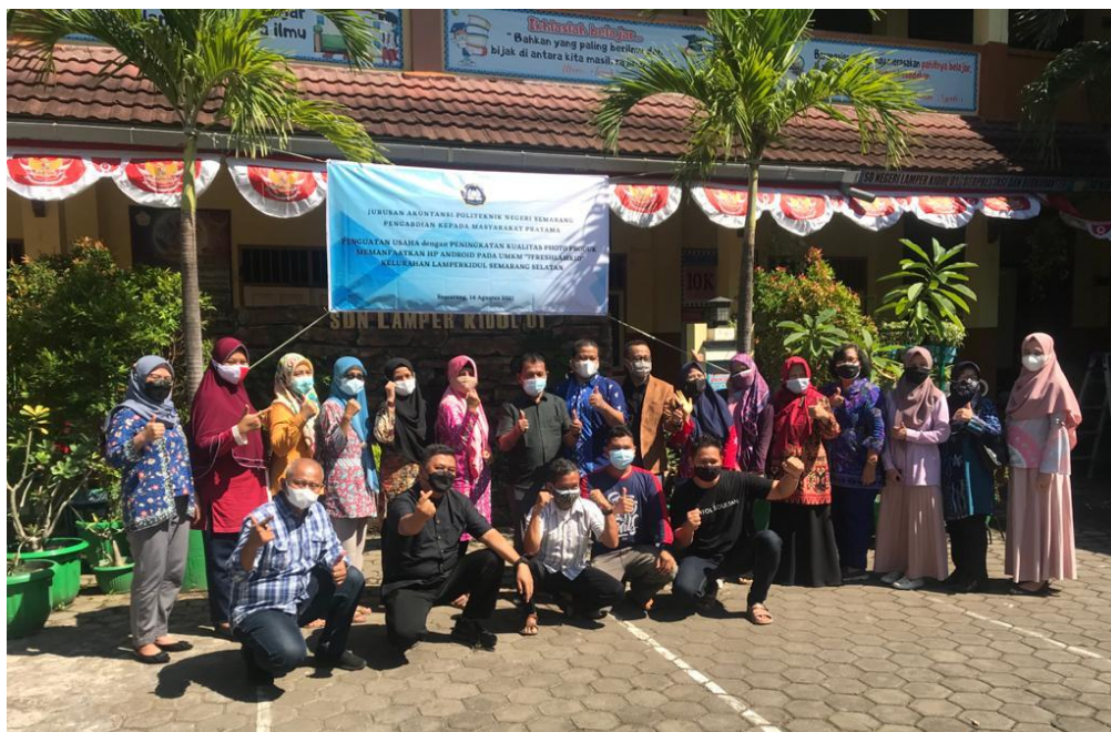
Gambar 3 Foto bersama Tim Pengabdian Masyarakat dengan UMKM Lamper Kidul