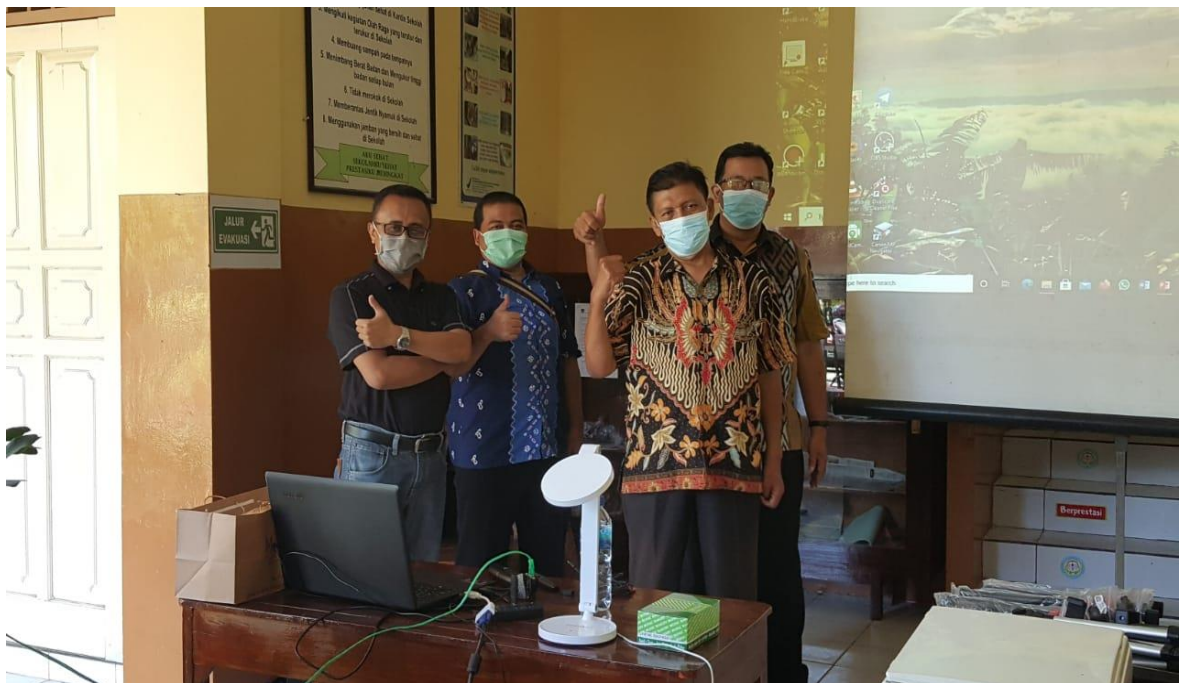
Gambar 1 Foto Tim Pengabdi Sumber : Dokumentasi Kegiatan, 2021