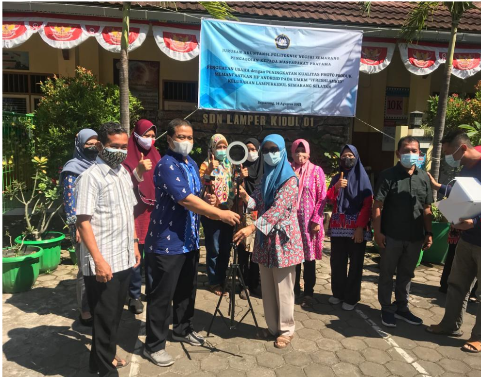
Gambar 4 Foto bersama Ketua Pengabdian Masyarakat dengan Ketua UMKM dalam rangka penyerahan alat-alat photography