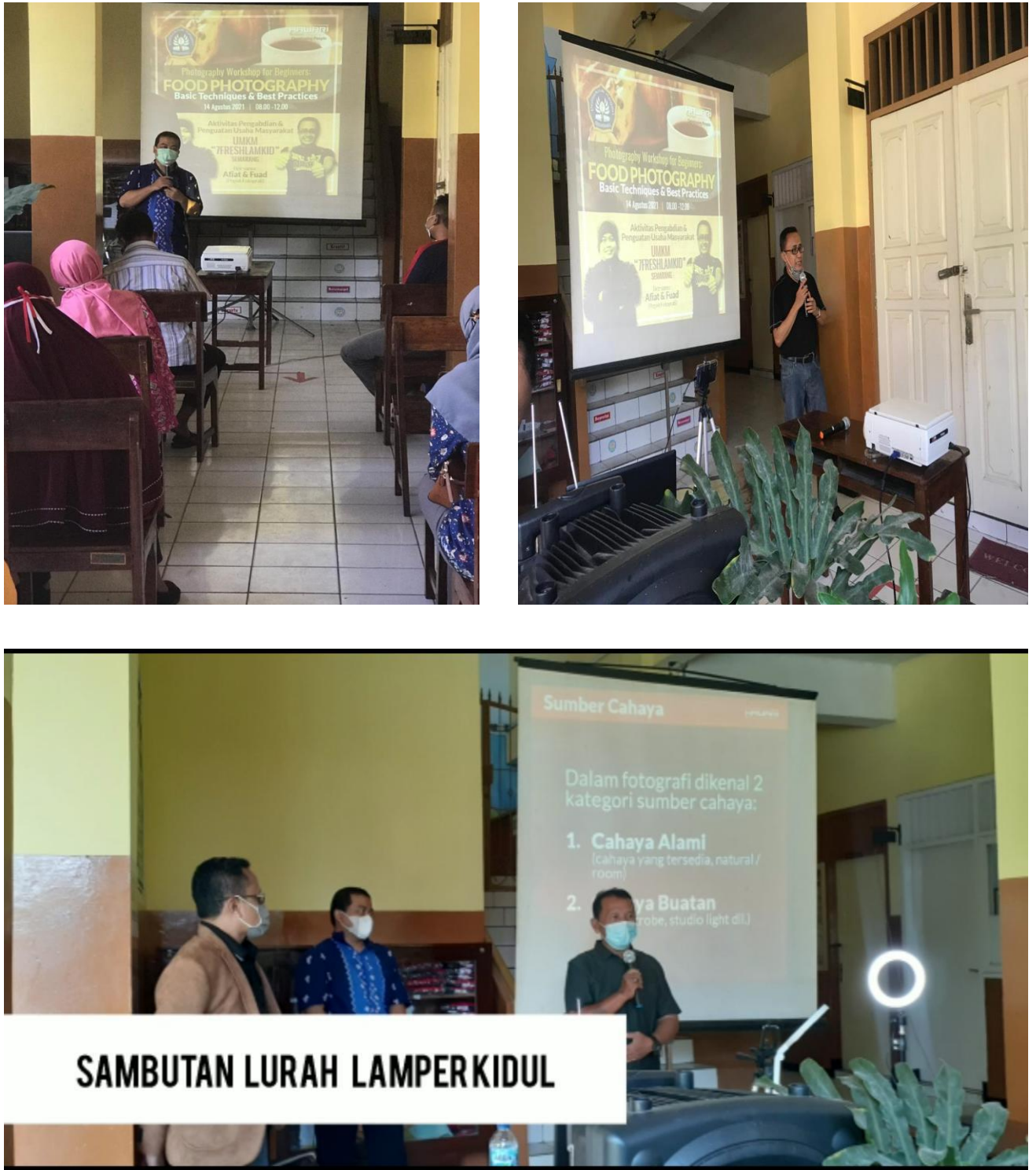
Gambar 2 Sambutan Kepala Kelurahan dan Ketua Pengabdian Masyarakat