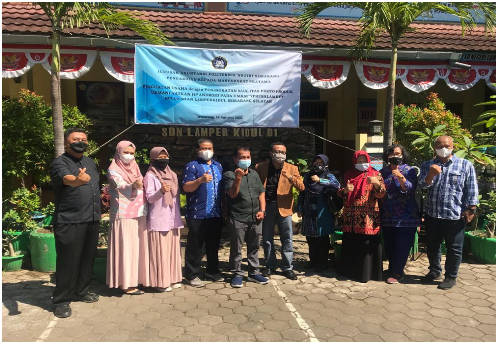
Gambar 3 Foto bersama Tim Pengabdian Masyarakat dengan Bapak Kepala Kelurahan Lamper Kidul Sumber : Dokumentasi Kegiatan, 2021