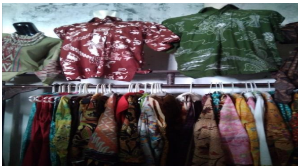
Gambar 1: Lokasi Obyek Mitra

adalah pakaian sehari-hari yang nyaman dipakai. Produk yang dihasilkan adalah baju panjang muslim, blus muslim yang bisa digunakan untuk bekerja maupun kegiatan yang lain serta daster. Khusus untuk daster dibuat dengan memanfaatkan ristan kain yang ada, sehingga tidak banyak seperti produk konveksi lainnya. Bahan baku yang digunakan kain lurik dan kain batik yang dapat dipesan dengan mudah dari pengusaha pembuat kain batik yang ada di Kampung Batik Laweyan. Proses produksi konveksi yaitu kain dipotong sesuai pola, di obras, dijahit, selanjutnya dilakukan finishing sesuai model dengan diberi kancing atau asesoris lainnya. Produk baru yang dihasilkan mengkombinasikan kain lurik dan kain batik. Proses produksi untuk produk konveksi mulai awal sampai produk jadi terdapat urutan yang pasti. Dengan demikian proses produksi untuk konveksi adalah terus menerus ( continuous process ), menurut Suwinardi dan Arif Nursyahid (2011). Berikut adalah gambar objek mitra: