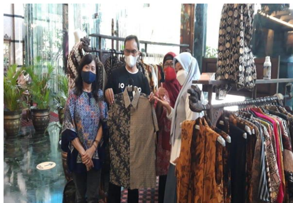
Gambar 9: Stand "Batik Enza" Di Hotel Royal Jl Slamet Riyadi Surakarta