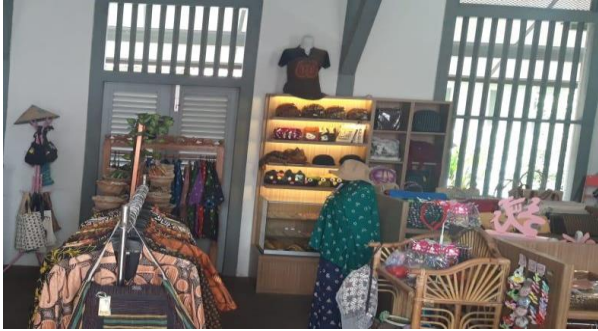
Gambar 3: Stand Batik Enza di De Colomadu