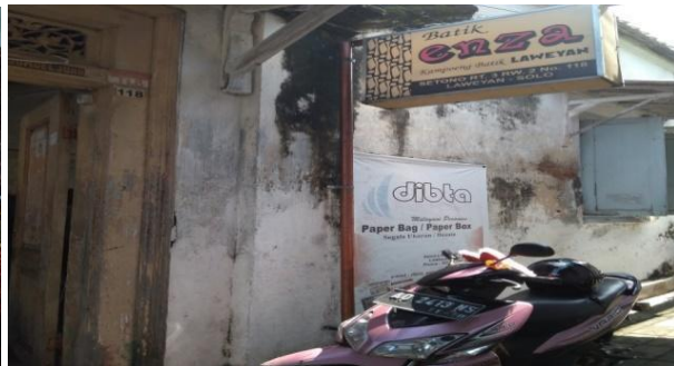
Gambar 2: Showroom Di Laweyan