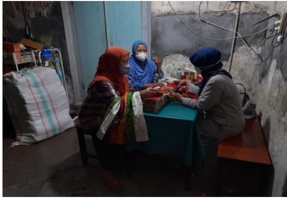
Gambar 7: Pelatihan Manajemen