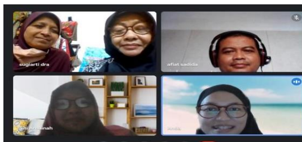
Gambar 10: Pelatihan Harga Pokok Produksi

Pelatihan Harga Pokok Produksi dan pelatihan Pemasaran dilakukan secara online.