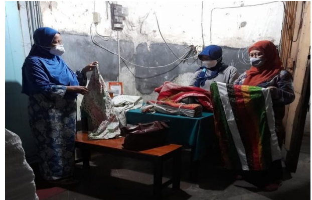
Gambar 8: Pelatihan Manajemen Produksi