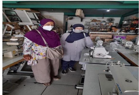
Gambar: 6. Survey Mesin Jahit