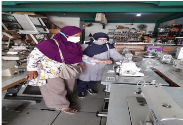
Gambar: 5. Survey Mesin Jahit

Kunjungan awal dilakukan sebelum dilaksanakan kegiatan pengabdian masyarakat. Kegiatan berikutnya survey mesin benang 4 yang akan diberikan ke objek mitra. (Gambar 5 dan Gambar 6)