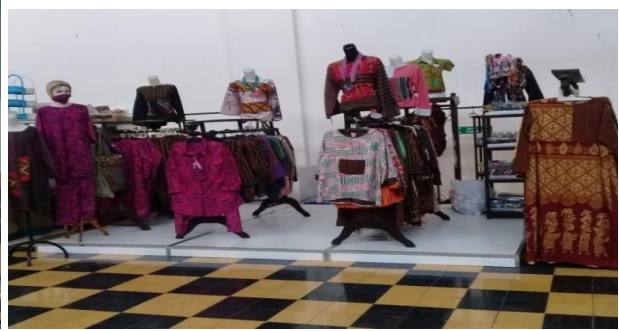
Gambar 4: Stand Batik Di Museum Keris

Usaha Konveksi Batik Enza mengalami perkembangan cukup pesat, diuntungkan dengan lokasi yang berada di Kampung Batik Laweyan sebagai pusat belanja batik dan area wisata, sehingga lokasi ini banyak dikunjungi wisatawan. Lokasi usaha merupakan faktor strategis yang sangat penting, seperti lokasi usaha Konveksi Batik Enza ini. Menurut Murdifin Haming dan Mahmud Nurnajamuddin (2011), lokasi dipilih dengan cermat dan hati-hati dengan mempertimbangkan berbagai aspek, diantaranya jenis usaha, skala usaha, ketersediaan bahan baku dan konsumen.