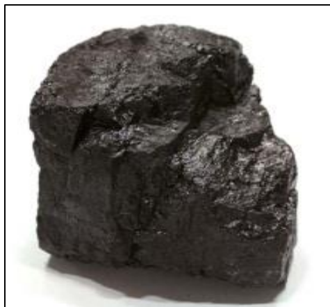
Gambar 2. Batu bara

Dari tabel di atas, PLTU Tanjung Jati B unit 2 menggunakan batubara jenis Subbituminous . Batubara jenis ini memiliki tekstur yang cukup keras, berwarna coklat tua – hitam dan memiliki kadar air 14 – 35%. Batubara subbituminous memiliki kadar karbon 50 – 70% Batubara jenis ini memiliki kandungan sulfur tidak lebih dari 1% dari beratnya. Batubara Subbituminous :