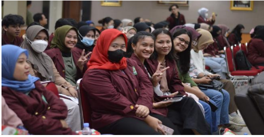
Gambar 2. Dokumentasi kegiatan Diskusi publik

Narasumber kedua menyampaikan mengenai pemanfaatan big data guna menciptakan peluang usaha. Era generasi Z informasi menjadi sebuah asset penting guna pengambilan keputusan sehingga keberadaan big data menjadi solusi. Big data merupakan kumpulan data dengan volume sangat besar terdiri dari data yang terstruktur, semi terstruktur dan tidak terstruktur yang terus berkembang dari waktu ke waktu. Karakteristik big data dari mulai volume yang sangat besar, datanya sangat beragam dan kecepatan akses data yang baik (Maryanto, 2017).