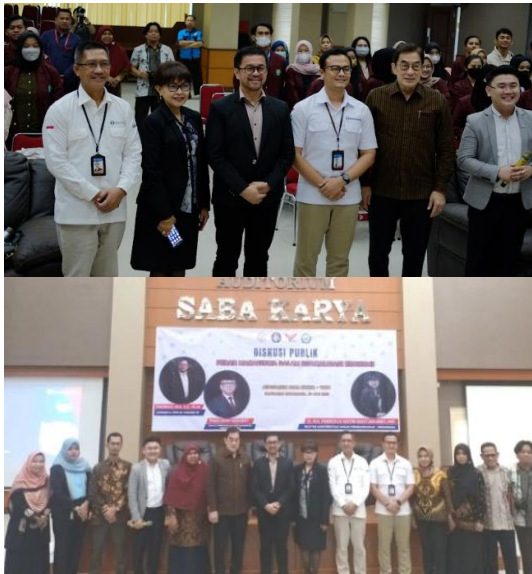
Gambar 3. Foto Bersama di akhir Kegiatan

Kegiatan diakhiri dengan foto bersama tim, narasumber dan peserta secara bergantian dipandu oleh moderator dan dilanjutkan dengan doa penutup yang dipandu oleh MC.