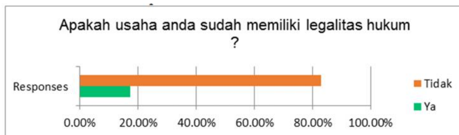
Gambar 2. Legalitas Hukum

Terjadi kesenjangan antara harapan sebagaimana norma hukum menginginkan dengan kenyataan yang ada dilapangan, bahwa masih belum pedulinya wirausahawan pemula terhadap legalitas usahanya khususnya memilili izin usaha mikro dan kecil (IUMK) bagi UMKM.