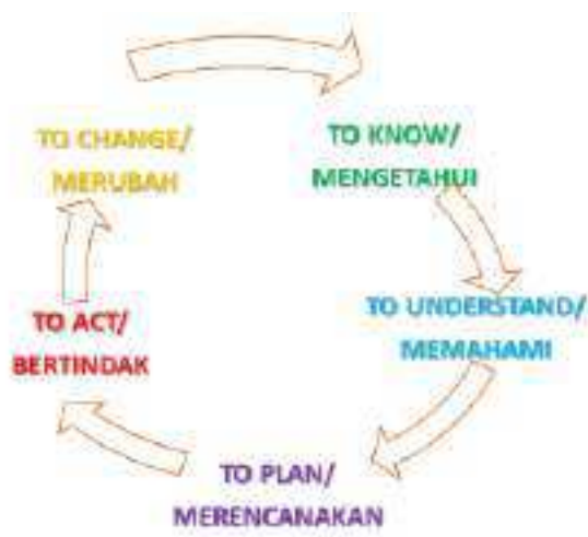
Gambar 2. Proses PAR

Pengabdian masyarakat ini dilaksanakan dengan menggunakan metode participatory action research (PAR). Pendekatan pengabdian kepada masyarakat (PKM) dengan Participatory Action Research (PAR) merupakan pendekatan yang prosesnya bertujuan untuk pembelajaran dalam mengatasi masalah dan pemenuhan kebutuhan praktis masyarakat, serta produksi ilmu pengetahuan (K.Denzin and S.Lincoln 2005:559), dan proses perubahan sosial keagamaan. PKM dengan pendekatan PAR ini merupakan PKM transformatif karena merupakan proses riset yang berorientasi pada pemberdayaan dan perubahan. Beberapa prinsip kerja Pengabdian kepada Masyarakat (PKM) dengan pendekatan Participatory Action Research (PAR) yang berorientasi pemberdayaan ini selalu mengupayakan tiga dimensi sekaligus: pemenuhan kebutuhan dan penyelesaian masalah praktis, pengembangan ilmu pengetahuan dan keberagaman masyarakat, dan proses perubahan sosial keberagaman. Dengan demikian maka masyarakat adalah agen utama perubahan sosial keagamaan, sehingga dosen/mahasiswa pelaksana PKM merupakan pihak lain yang melakukan fasilitasi dari proses perubahan tersebut. Oleh karenanya dalam pelaksanaan PKM ini tim dosen dan mahasiswa menghormati peran utama masyarakat sebagai khalayak sasaran. Dosen, mahasiswa dan masyarakat mitra pengabdian yaitu pimpinan cabang GP Ansor kabupaten Temanggung saling bahu membahu secara partisipatif untuk melakukan perubahan sosial (Suwendi, Basir, and Wahyudi 2022:9).