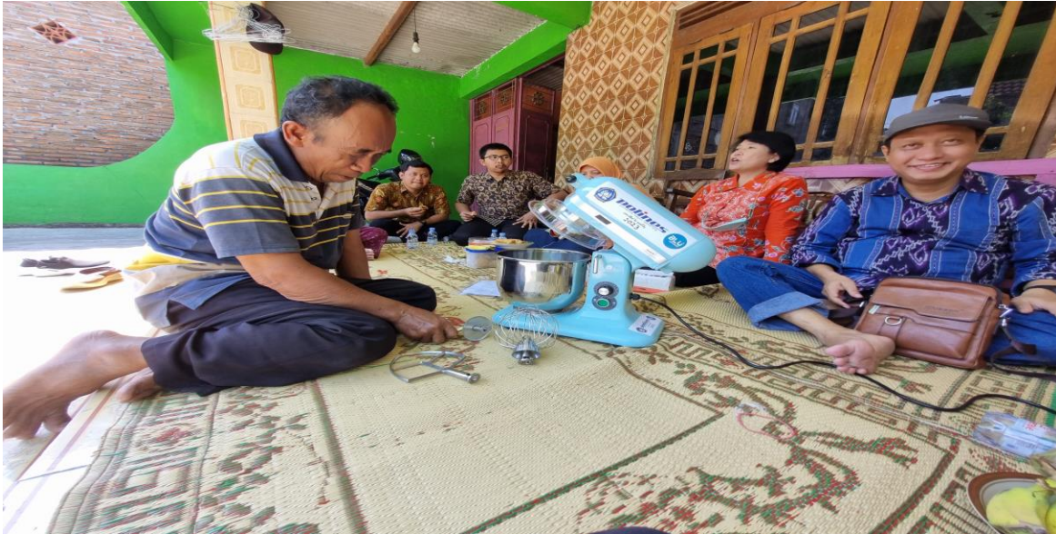
Gambar 5. Mitra belajar mengoperasikan Mixer bantuan Pengabdi.