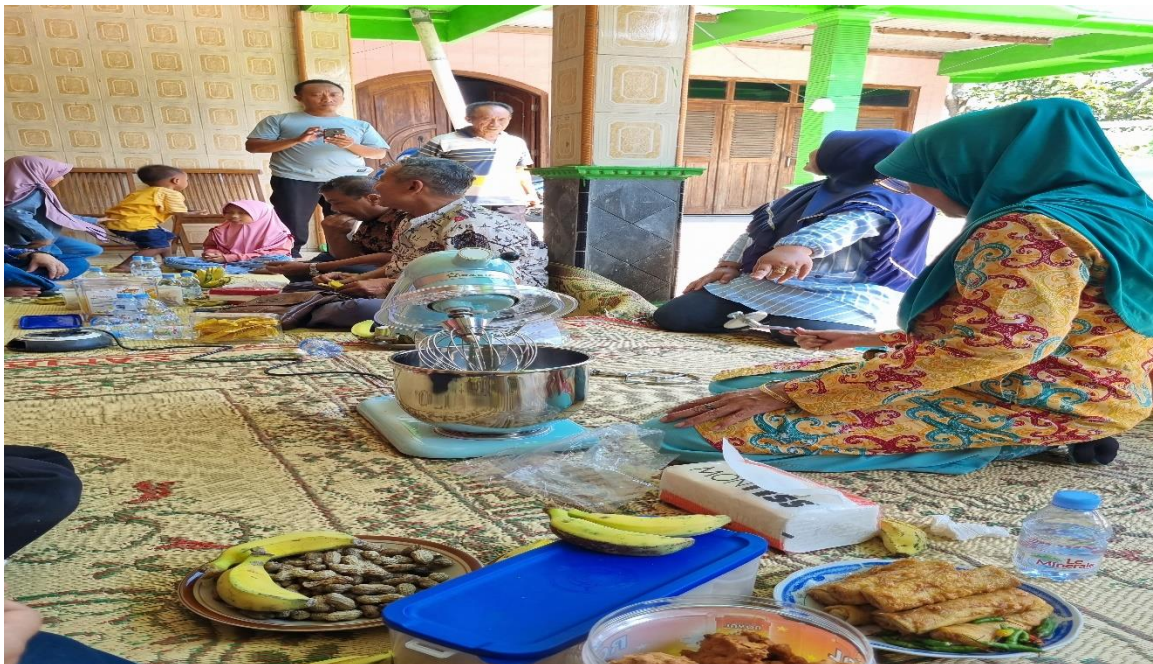
Gambar 4. Tim Pengabdian menjelaskan cara mengoperasikan kepada Mitra.