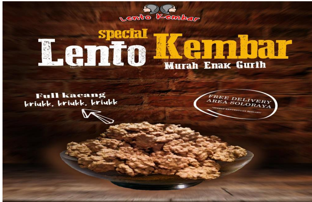
Gambar 2. Merk Lento Mintra Pengabdian