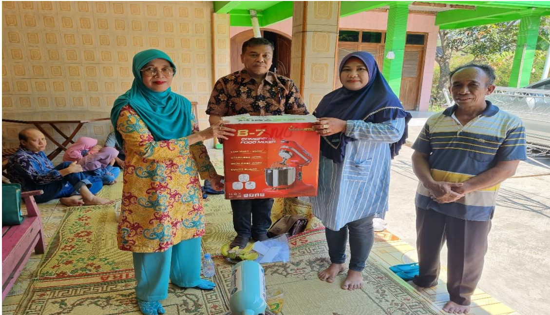
Gambar 3. Serah terima alat berupa Mixer dari Tim Pengabdian kepada Mitra Pengabdian

Karena Mitra tidak bisa menaikkan harga jual, menyesuaikan harga bahan baku yang naiknya. Untuk harga jual tergantung juga pada persaingan dari produk yang sejenis. Meskipun Mitra mempunyai pelanggan tetap yang akan membeli karena ingin mengenang makanan khas kota Boyolal