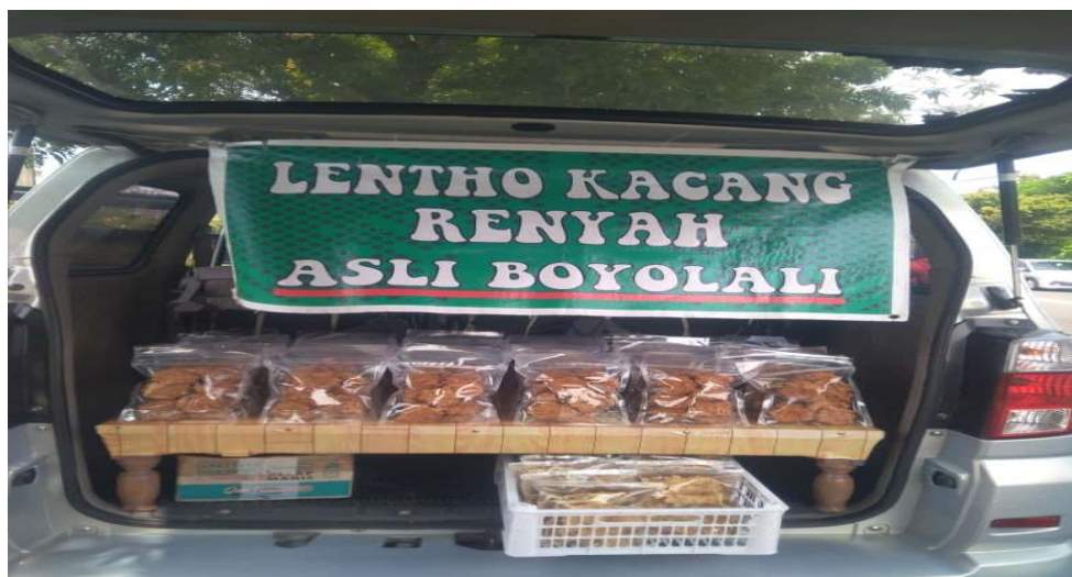
Gambar 1. Lapak Lentho Mintra Pengabdian

Hal tersebut dirasakan berat sehingga dibutuhkan peralatan yang dapat meringankan cara pengolahan dan juga belum ada perhitungan harga pokok dan harga jual