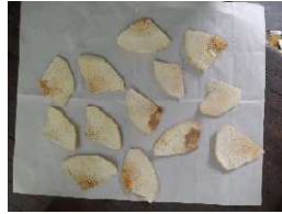
Gambar 4. Hasil Irisan Buah Sukun Pengujian ke 1

Menggunakan pisau pemotong dengan tebal 2 (mm) dan kemiringan sudut mata pisau 30°, kecepatan putaran 80 rpm dan waktu yang dihasilkan untuk memotong 1 buah sukun dengan berat 0,900 (kg) adalah 30 detik.