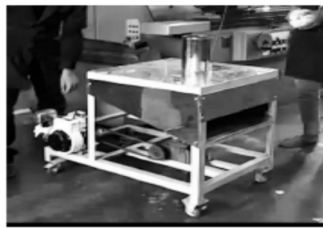
Gambar 3. Mesin pengiris buah sukun dengan penggerak motor bensin 5,5 hp

Menindaklanjuti desain mesin, tahapan langkah selanjutnya adalah merealisasi rancangan tersebut. Hasil dari realisasi desain tersebut dapat dilihat pada Gambar 3.