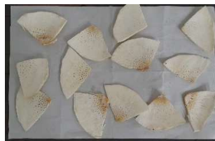
Gambar 5. Hasil Irisan Buah Sukun Pengujian ke 2

Menggunakan pisau pemotong dengan tebal 2 (mm) dan kemiringan sudut mata pisau 30°, kecepatan putaran 100 rpm dan waktu yang dihasilkan untuk memotong 1 buah sukun dengan berat 0,919 (kg) adalah 23 detik.