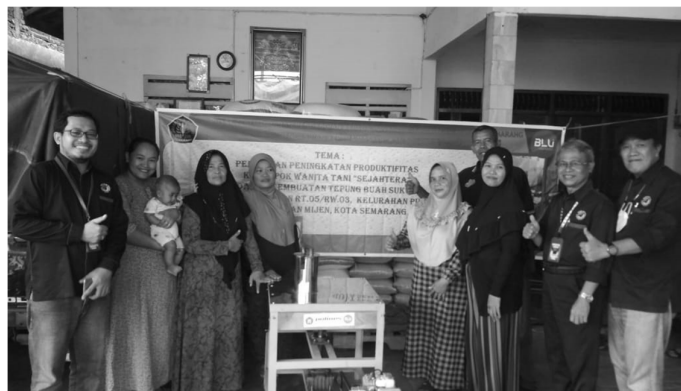
Gambar 7. Serah terima mesin pengiris buah sukun untuk bahan baku pembuatan tepung sukun dari tim PMK 2023 kepada KWT “SEJAHTERA”.

d) Pendampingan dan pelatihan penerapan teknologi tepat guna dalam upaya peningkatan produktifitas pembuatan tepung buah sukun telah selesai dilaksanakan