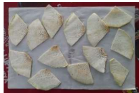
Gambar 6. Hasil Irisan Buah Sukun Pengujian ke 3

Menggunakan pisau pemotong dengan tebal 2 (mm) dan kemiringan sudut mata pisau 30°, kecepatan putaran 160 rpm dan waktu yang dihasilkan untuk memotong 1 buah sukun dengan berat 0,970 (kg) adalah 18 (sekon).