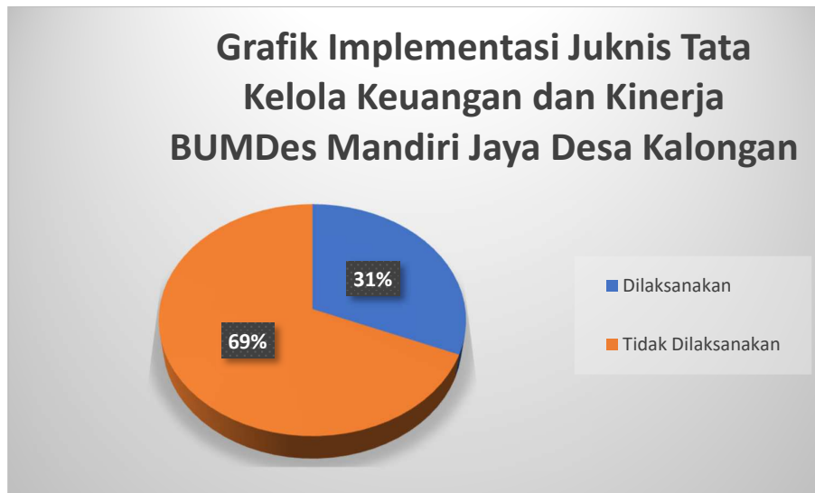
Gambar 1. Implementasi Juknis Tata Kelola keuangan BUMDes Mandiri Jaya Desa Kalongan