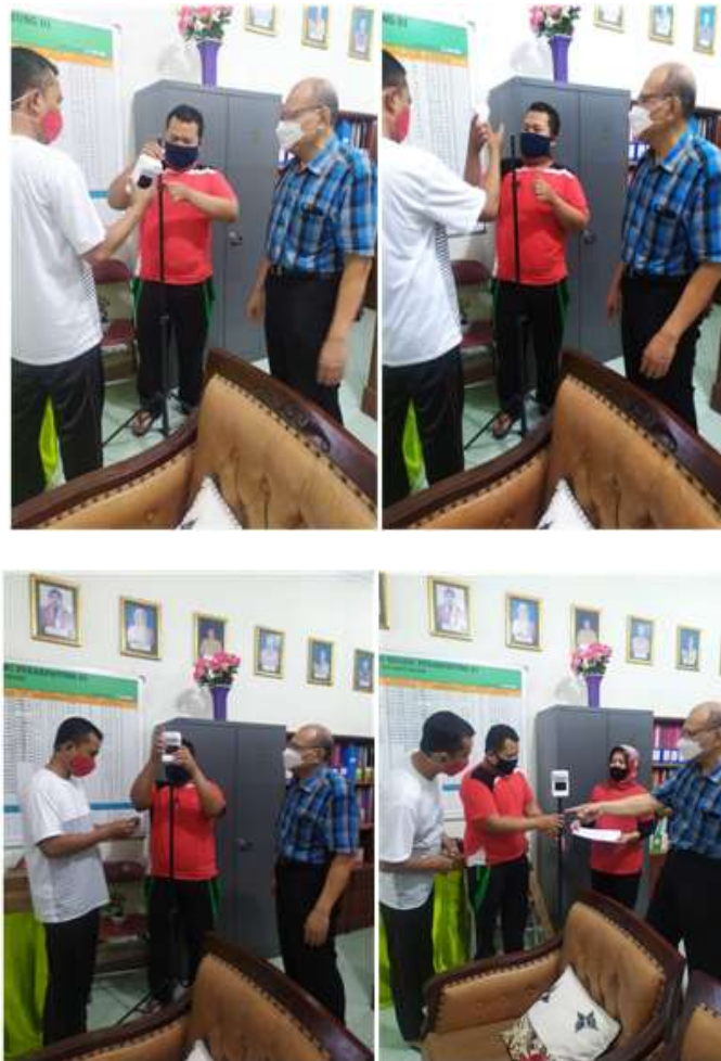
Gambar 7. Proses pemasangan, pengoperasian dan perawatan alat.

Proses pemasangan dilakukan dengan memasang alat ukur suhu pada tripot. Untuk pengoperasian alat ini dapat dilakukan dengan cara menekan tombol power sesaat. Perawatan alat ukur suhu tubuh ini dapat dilaksanakan dengan cara memeriksa kondisi baterai secara kontinyu. Bila baterai habis, maka segera dicas menggunakan cas Hp. Proses kegiatan ini dapat dilihat pada Gambar 7.