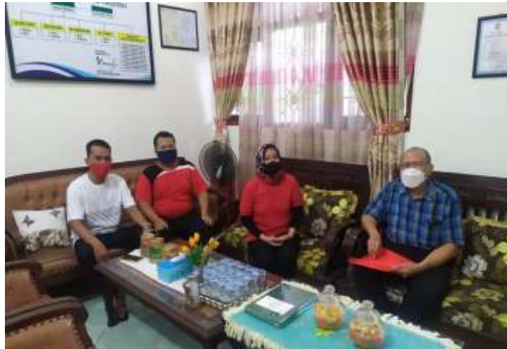
Gambar 3. Diskusi identifikasi permasalahan mitra

Permasalahan yang dialami SDN Pudak Payung 01 adalah terbatasnya jumlah alat pengukur suhu tubuh yang otomatis tanpa sentuh dan tanpa operator untuk mendukung prosedur kesehatan di lingkungan sekolah. Kegiatan diskusi identifikasi masalah dapat dilihat pada Gambar 3.