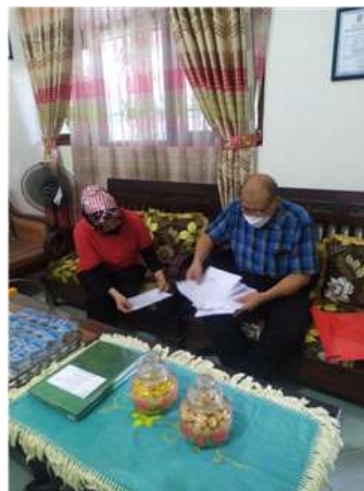
Gambar 4. Proses penandatanganan surat-surat

Melakukan kegiatan untuk memberi solusi permasalahan dengan cara penyediaan alat pengukur suhu tubuh otomatis tanpa kontak, secara mandiri tanpa operator, beserta kelengkapannya. Proses penandatanganan surat-surat berkaitan dengan barang-barang yang dihibahkan dapat dilihat pada Gambar 4, sedangkan proses penyerahan barang dapat dilihat pada Gambar 5.