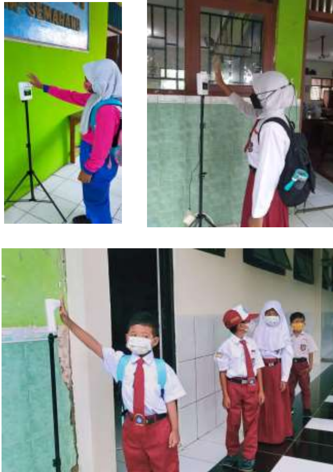
Gambar 8. Pengukuran suhu tubuh pada murid-murid SDN Pudak Payung 01.

sehingga resiko menularnya virus dapat diketahui dan dicegah lebih awal. Proses pengukuran suhu tubuh oleh murid-murid dapat dilihat pada Gambar 8.