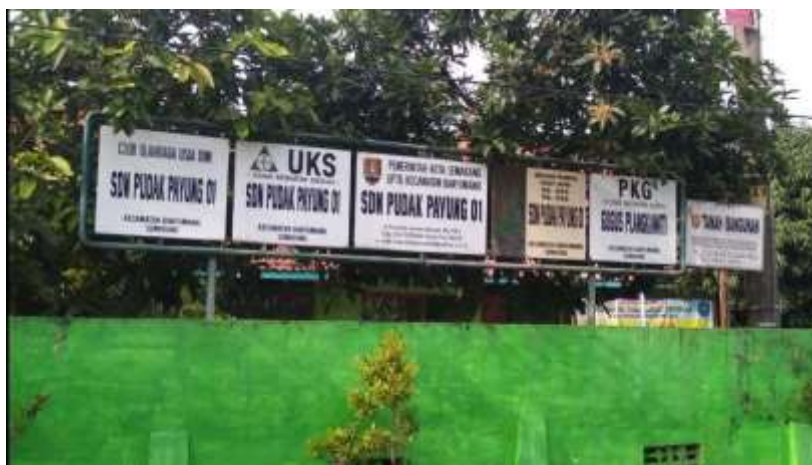
Gambar 1. Lokasi SDN Pudak Payung 01