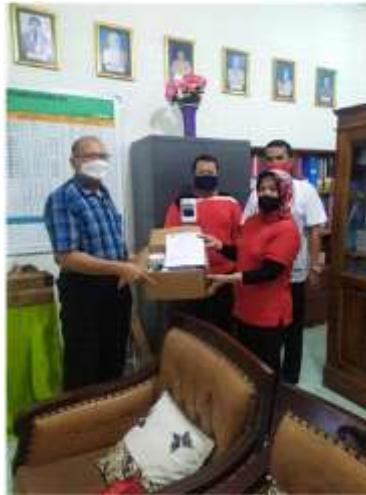
Gambar 5. Proses penyerahan barang hibah

Barang-barang yang dihibahkan (gambar 6) terdiri dari : a) 5 set pengukur suhu dan tripot, b) 5 buah cas HP untuk mengisi baterai 18650, c) sebuah power bank 500mAH dan d) 5 buah kabel ekstensi..