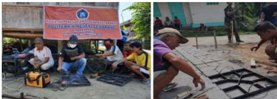
Gambar 3. Kegiatan pengelasan cetakan paving