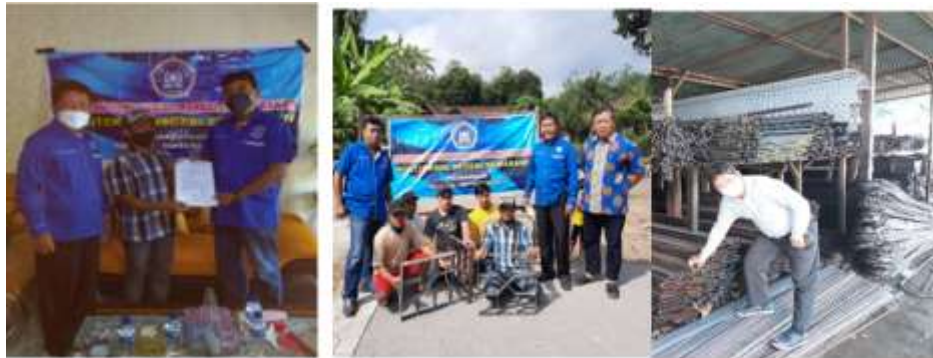
Gambar 2. Serah terima barang

Aplikasi teknologi pengelasan listrik untuk pembuatan cetakan paving menghasilkan 3 (tiga) set cetakan ukuran luar 500x500 (mm) dari bahan baja pelat strip tebal 5 (mm) lebar 60 (mm). Sumber listrik dari generator set 5500 (watt) dan mesin las trafo inverter 125 ampere. Kawat elektroda 2,6 (mm). Tim pelaksana sebagai instruktur sedangkan pelaksana pengelasan warga masyarakat dusun Gedongan Lor, kelurahan Bondowoso, kecamatan Mertoyudan, kabupaten Magelang. Konstruksi cetakan paving dibuat dengan motif yang sudah disepakati bersama sehingga antusiasme warga untuk mencoba hasil cetakan paving block. Tim pengabdian membantu pasir satu truck sekitar 7 (m 3 ) untuk mempraktekkan cetakan paving block. Selanjutnya warga tergerak, termotivasi membantu semen mulai dari 3 sak sampai 10 sak. Pelaksanaan pembuatan paving block dilakukan siang dan malam oleh warga masyarakat. Hasilnya sekitar luas 200 (m 2 ) sudah terpasang di halaman masjid Nafisatul Iman Gedongan Lor desa Bondowoso. Gambar 2 menunjukkan serah terima barang, dan gambar 3 menunjukkan pembuatan cetakan paving dan penerapan cetakan paving block di halaman masjid.