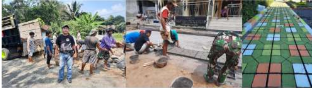
Gambar 4 Ujicoba Cetakan paving blok

pelaksana pengabdian melakukan pendampingan selama kegiatan mulai dari persiapan/perencanaan, pelaksanaan, dan evaluasi kegiatan. (gambar 4)