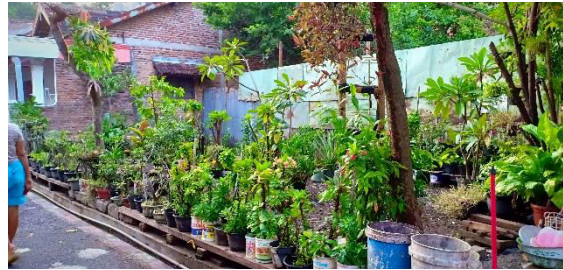
Gambar 1. Kondisi tanaman dalam pot di lingkungan kelompok Tani RT 7 RW 1

yang sempit sebagaimana tampak dalam gambar berikut ini adalah situasi lingkungan obyek sasaran :