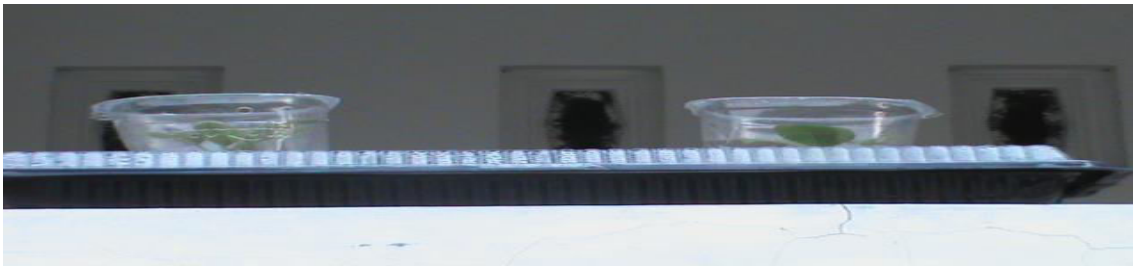
Gambar 3. Hasil latihan Ibu2 dengan kreasi barang bekas yang dijadikan media tanam

Dampak yang diperoleh Mitra : Mitra mendapatkan bagaimana cara menanam sayur dilahan sempit dengan metode hidroponik kemudian dipraktikkan dan menghasilkan sayur yang sehat dan labih segar. Sayur yang dihasilkan ternyata dapat menghemat pengeluaran belanja. Penghematan pengeluaran belanja amat sangat membantu ekonomi keluarga, diharapkan apabila panen sayur berlebih bias dijual akan menambah pendapatan keluarga walau usahanya masih skala rumah tangga.