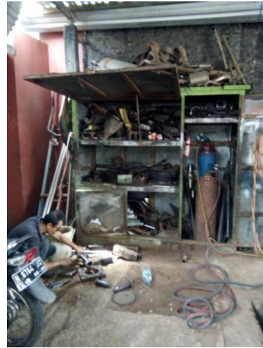
Gb. Bengkel knalpot Jalan Setiabudi

Produktifitas UKM tersebut dalam sebulan bisa menghasilkan 20 buah knalpot disamping setiap hari ada yang melakukan perbaikan. Dari usaha pembuatan dan perbaikan knalpot kendaraan bermotor tersebut penghasilannya mencapai sepuluh juta hingga dua puluh juta rupiah per bulan.