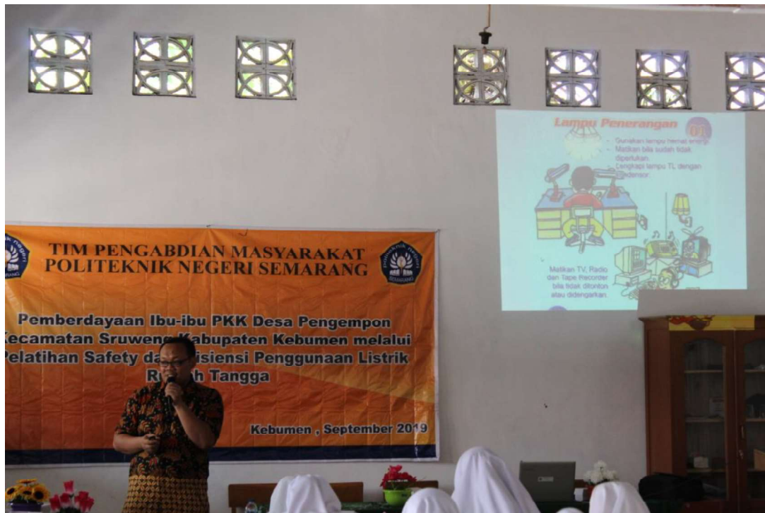
Gambar 3 . Dokumentasi kegiatan