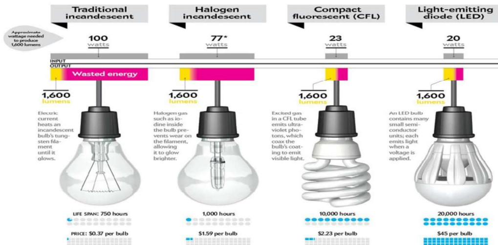
Gambar 1 Perkembangan Pemakaian Lampu

Penggunaan lampu hemat energi sudah sejak lama mulai di kembangkan. Perkembangan lampu hemat energi bisa dilihat apada gambar 1 dibawah ini :