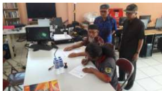
Gambar 7. Penanda tangan kerjasama oleh koordinator BLC