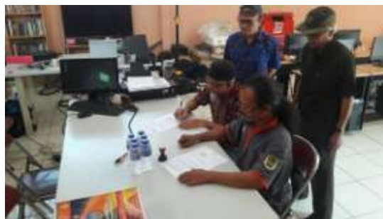
Gambar 6. Penanda tangan kerjasama oleh ketua