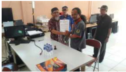
Gambar 8. Berita Acara Serah terima Alat