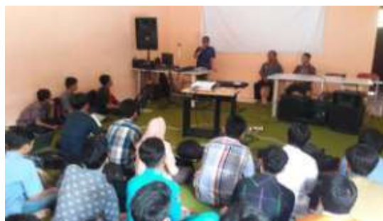
Gambar 5. Pelatihan