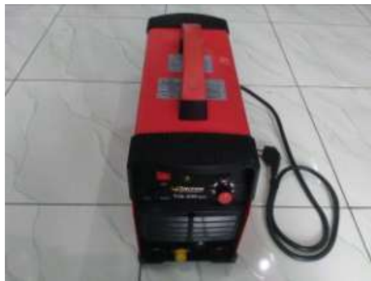
Gambar 2. Alat Las TIG