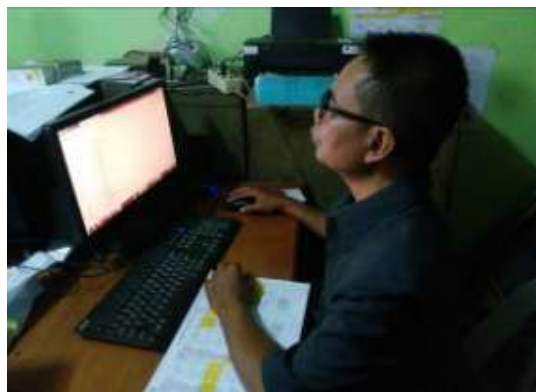
Gambar 10. Pembuatan Modul Pelatihan