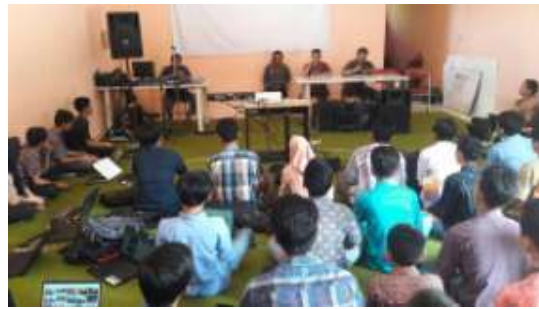
Gambar 4. Pelatihan Oleh Ketua