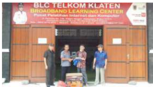
Gambar 9. Penyerahan Alat Las kepada koodinator BLC