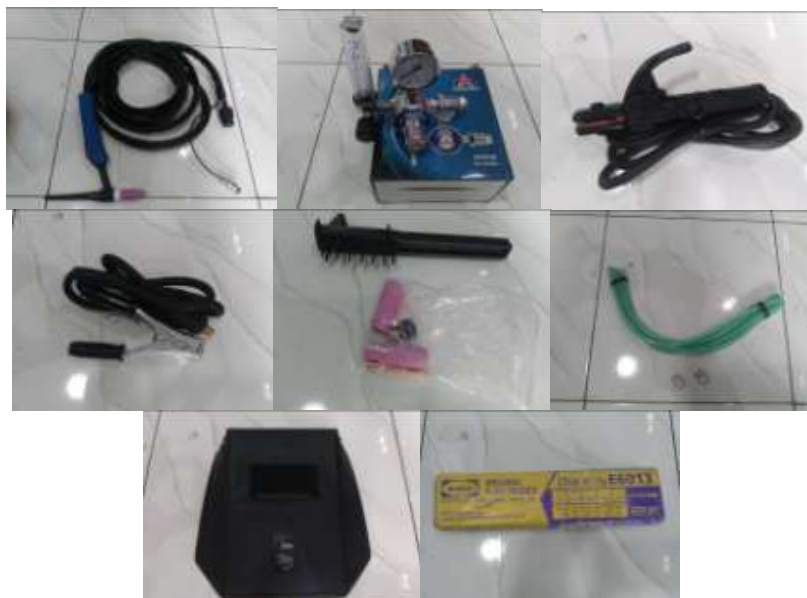
Gambar 3. Perlengkapan las TIG