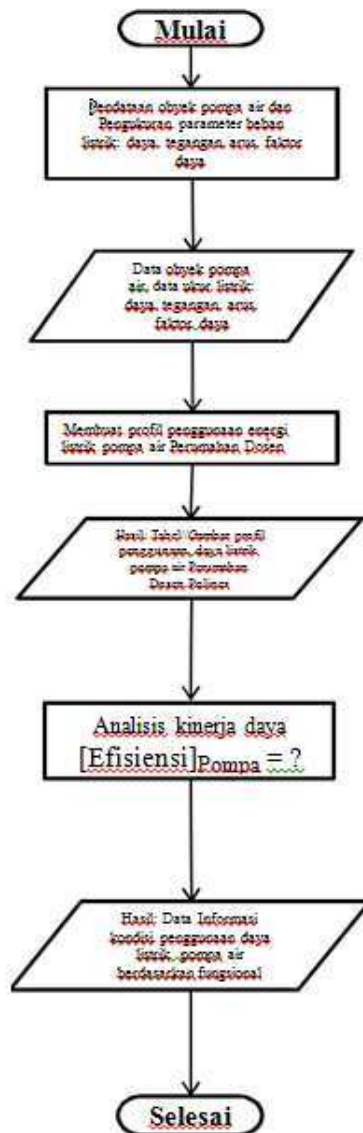
Gambar-2.2 Tahapan Prosedur Penelitian Perbaikan Faktor Daya Listrik

Peubah (Variabel) penelitian ini berujud penggunaan daya listrik, yaitu kuantitas atau jumlah daya listrik (kW) yang digunakan oleh mesin pompa air. Variabel tersebut bersifat gayut ( dependent ) oleh adanya pengaruh variabel bebas ( independent ) yaitu tegangan (volt) dan arus (amper) serta faktor daya ( \cos \phi ) pada beban mesin pompa bertenaga listrik yang digunakan. Sedangkan kerja mesin pompa menjadi variabel antara ( intervent ) yang membedakan kebutuhan mesin pompa air bertenaga listrik sesuai sifat fungsionalnya. (Sugiyono: 2011, 4-7).