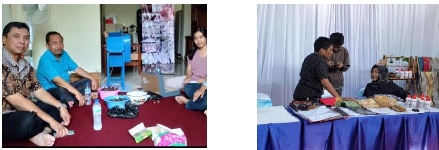
Gambar 4. Training Mesin Pemecah Biji Lerak dan Display Produk pameran

Pada kegiatan berikutnya adalah dilakukan desain kemasan produk dan pembuatan website untuk promosi dan pemasaran secara online, dalam pelatihan ini UMKM diharapkan dapat memiliki alternatif desain kemasan produk sabun lerak. Aplikasi promosi dan pemasaran secara online dapat diakses di website secara online dengan alamat sebagai berikut : . https://riezasabunlerak.blogspot.com/ . Seperti pada Gambar 5.