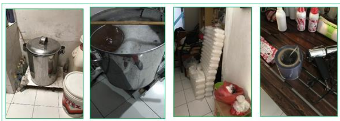
Gambar 2. Daging buah Lerak direbus, disaring menjadi sabun lerak kemudian disiapkan botol untuk dimasukan dan dipacking dan diberi label