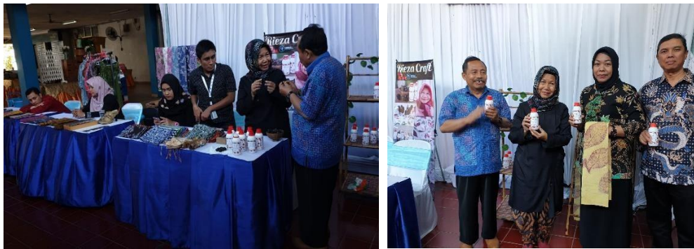
Gambar 3. Pameran Produk Sabun Lerak

Kegiatan berikutnya adalah meliputi promosi melalui display produk pada pameran pameran dan pelatihan pengoperasian/ maintenance mesin pemecah biji lerak serta pembuatan website untuk promosi secara online seperti Gambar 3 dan Gambar 4.