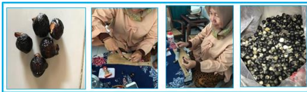
Gambar 1. Bahan baku Lerak kemudian dikupas dengan pisau dan telenan dan hasil kupasan